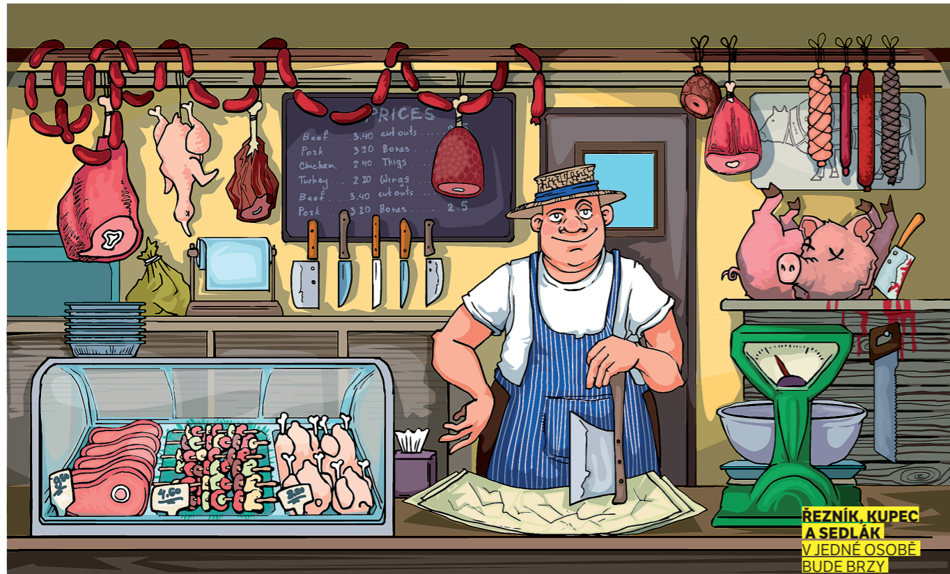
REZNIK, KUPEC A SEDLÁK V JEDNÉ OSOBĚ BUDE BRZY NEDOSTATKOVÝM ZBOŽÍM.

Ž ivnostník začíná být ohroženým druhem. Tedy ten, který je skutečně aktivní a nemá živnostenské oprávnění jen pro parádu nebo na vedlejší samostatnou výdělečnou činnost. Za rok 2015 jich zaniklo zhruba osm tisíc. A trend pokračuje: jen během prvních tří měsíců tohoto roku ubylo dalších šest tisíc lidí, které podnikání skutečně živi.